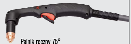
Palnik ręczny 75°

(więcej opcji palników można znaleźć w witrynie www.hypertherm.com )