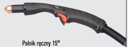
Palnik ręczny 15°